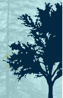
Peral pyrus communis

Árbol de la familia de las cupulíferas, de diez a doce metros de altura, con tronco grueso, formando una copa grande y redonda.