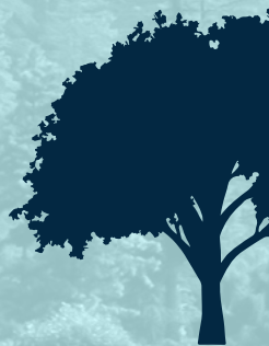
Encino quer cus

Árbol de la familia de las cupulíferas, de diez a doce metros de altura, con tronco grueso, formando una copa grande y redonda.