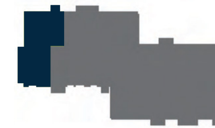
Ubicación del departamento

Todas las imágenes, planos y textos aquí mostrados son únicamente informativos y pueden tener cambios sin previo aviso.