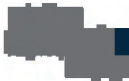
Ubicación del departamento

Todas las imágenes, planos y textos aquí mostrados son únicamente informativos y pueden tener cambios sin previo aviso.