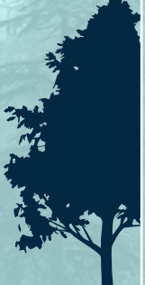
Magnolia magnolia grandiora

Crece de 2 hasta 20 m de altura y su fruto es la pera. Vive de promedio 65 años, aunque puede llegar hasta los 400 años.