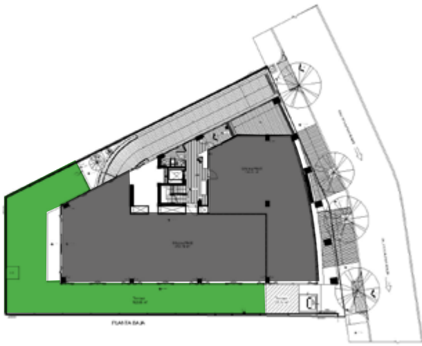
ÁREA DE OFICINAS ÁREA DE TERRAZA